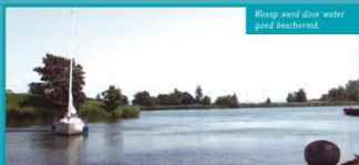
Weesp werd door water goed beschermd.