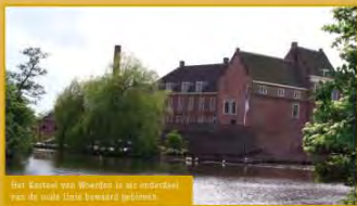
Het Kasteel van Woerden is een onderdeel van de oude IJssel oeverzijde.