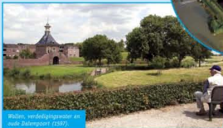
Wolven, verdedigingsvesting en oude Dalempoort (1597).

De Hollandse waterlinie bouwde voort op middeleeuwse fundamenten.