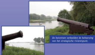
De kanonnen verbeelden de beheersing van het strategische rivierenoord.