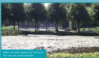
Alleen de linker waterpartij herinnert hier aan het vestingverleden.