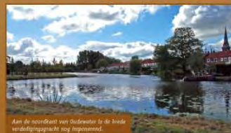
Aan de noordkant van Oudewater is de brede verdedigingsgracht nog ingevonden.