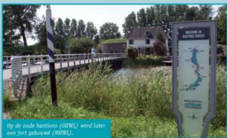
Op de oude bastions (OGWL) werd later een fort gebouwd (NHWL).