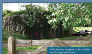
Goed bewaard torenfort uit het midden van de negentiende eeuw.