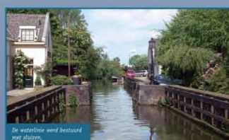
De waterlinie werd bestuurd met sluizen.