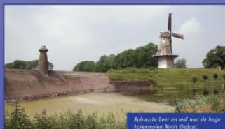
Robuuste beer en wal met de hoge korenmolen Nooit Gedagt.

Informatie: VVV Zuid-Holland Zuid: www.vvvgorinchem.nl Gorinus Museum: www.gorinchemmuseum.nl Slot Loevestein Poederlijen: www.slotloevestein.nl Toeristen Informatiebureau: www.toeristeninfo-woudrichem.nl Visserij en Cultuurhistorisch Museum: www.visserijmuseumwoudrichem.nl Stadsgalerij: www.stadsgalerie.nl