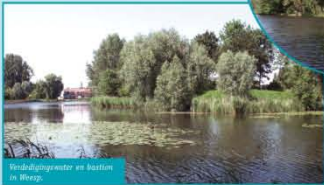
Verdedigingswerken en bastion in Weesp.