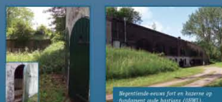
Negentiende-eeuws fort en kazernes op fundament oude bastions (OGWL).