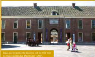
Voormalig oorlogsschip op de IJssel van de Grote Hollandse Waterlinie (1749).