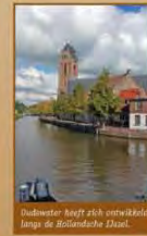
Oudewater heeft zich ontwikkeld langs de Hollandse IJssel.