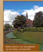
Bekend park met bejaardencentra op voormalige vestingwerken.