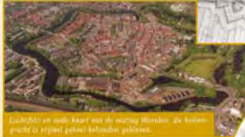
Zuidelijk en noordelijk deel van de vesting Woerden, de Grote gracht is vrijwel geheel behouden gebleven.