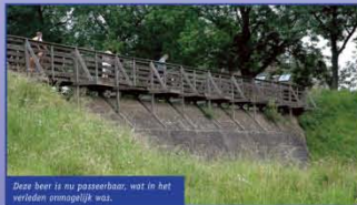
Deze beer is nu paardenhoe, wat in het verleden onmogelijk was.