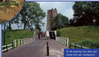
In de opening van deze wal stond ooit een stadspoort.