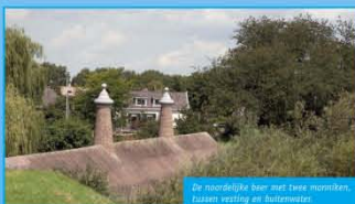
De rondere beer met twee munitiehuizen vesting en buitenwerken.