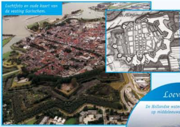
Luchtfoto en oude kaart van de vesting Gorinchem.

Goed bewaard gebleven stadswallen, met diverse bastions en twee walmolens (De Hoop en Nooit Volmaakt), Tolhuis, Dalempoort langs de Merwede, Doelen en Lingsluis.