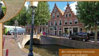
Het schilderachtige historische centrum van Oudewater.