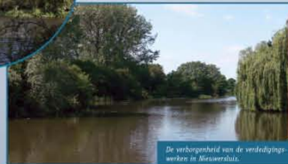
De verborgenheid van de verdedigingswerken in Nieuwersluis.