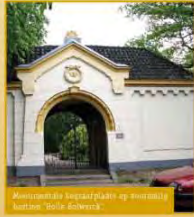
Monumentale toegangspoort op 'Nieuw Schied' in Woerden.