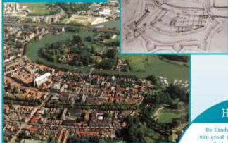
Luchtfoto en oude kaart van vestingplan Weesp (1672-1673).

Vestingstructuur uit 1673-1676, een negentiende-eeuws fort aan de Ossenmarkt, houten huisjes in oude schootsvelden en een stadspark.