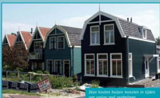
Deze houten huizen moesten in tijden van oorlog snel verrijzen.