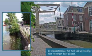
De inundatieklein: het hart van de vesting, met verhoogen heer (links).