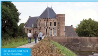
Het Tolhuis naast brug op het Tolbecken.