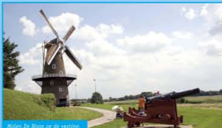
Molen De Hoop op de vesting wal van Gorinchem.