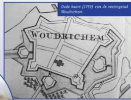
Oude kaart (1759) van de vestingstad Woudrichem.

Authentiek vestingstadje met omwalling, daarop de walmolen Nooit Gedagt, verder o.m. een Kazerne en een Arsenaal. Ten oosten van Woudrichem Fort Loevestein, het uiterste punt van de vestingdriehoek aan de Merwede (Gorinchem-Woudrichem-Loevestein).