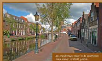
Nu onzichtbaar, maar in de achttiende eeuw zwaar versterkt gebied.